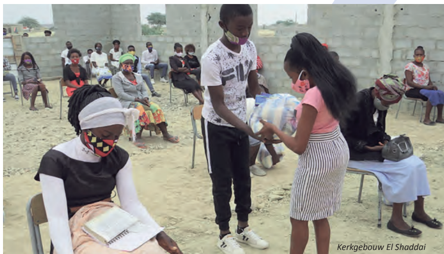
Kerkgebouw El Shaddai

Ook worden er voedselpakketten uitgedeeld. De auto waar grote behoefte aan was, is inmiddels wel aangeschaft, maar een flink deel nog op afbetaling. Uw hulp middels gebed en/of een financiële gift voor dit project is zeer welkom!